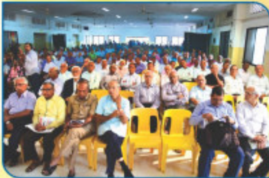
A section of the audience